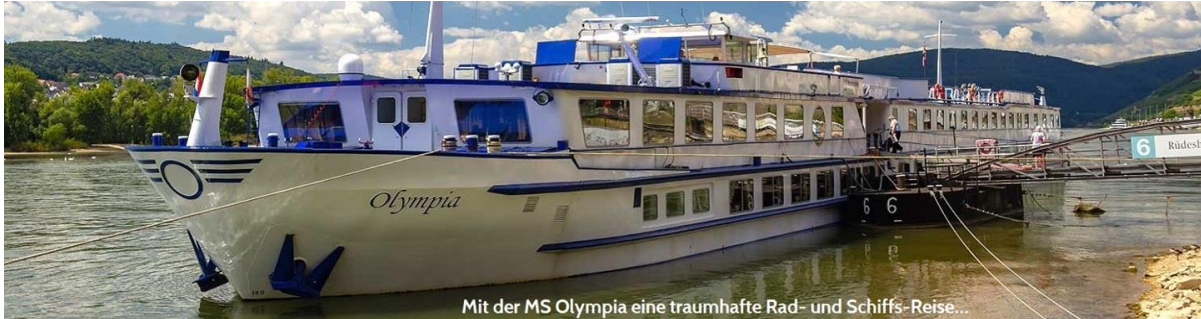
Mit der MS Olympia eine traumhafte Rad- und Schiffs-Reise...