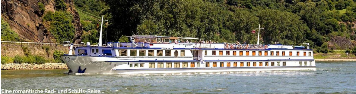
Eine romantische Rad- und Schiffs-Reise...