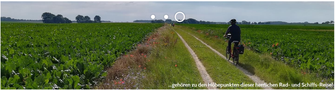
...gehören zu den Höhepunkten dieser herrlichen Rad- und Schiffs-Reise!

Sie befinden sich hier: Reiseziele > Rad und Schiff > Deutschland > Stralsund-Rügen-Usedom-Oder-Berlin