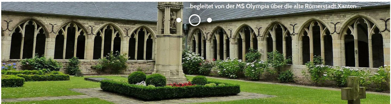
...begleitet von der MS Olympia über die alte Römerstadt Xanten...

Sie befinden sich hier: Reiseziele > Rad und Schiff > Rhein > Rotterdam-Köln