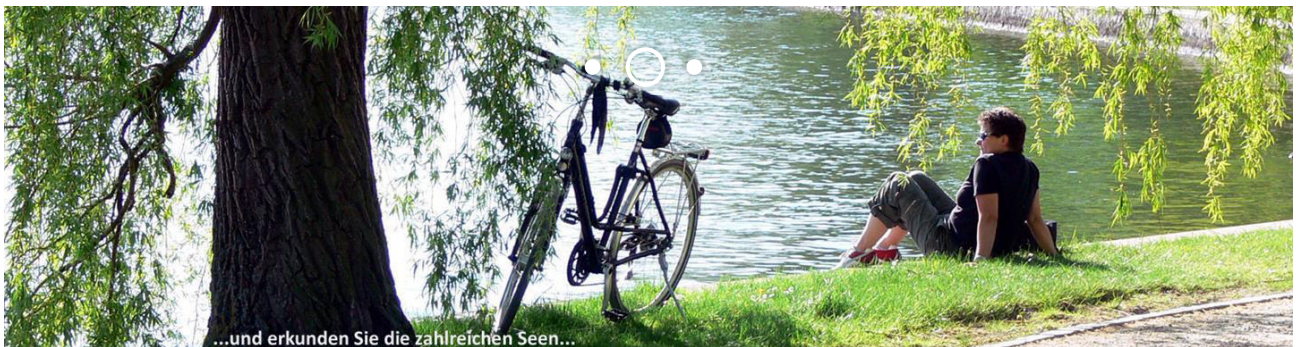
...und erkunden Sie die zahlreichen Seen...

Sie befinden sich hier: Reiseziele > Deutschland > Mecklenburg > Mecklenburgische Seenplatte: Müritz und Plauer See