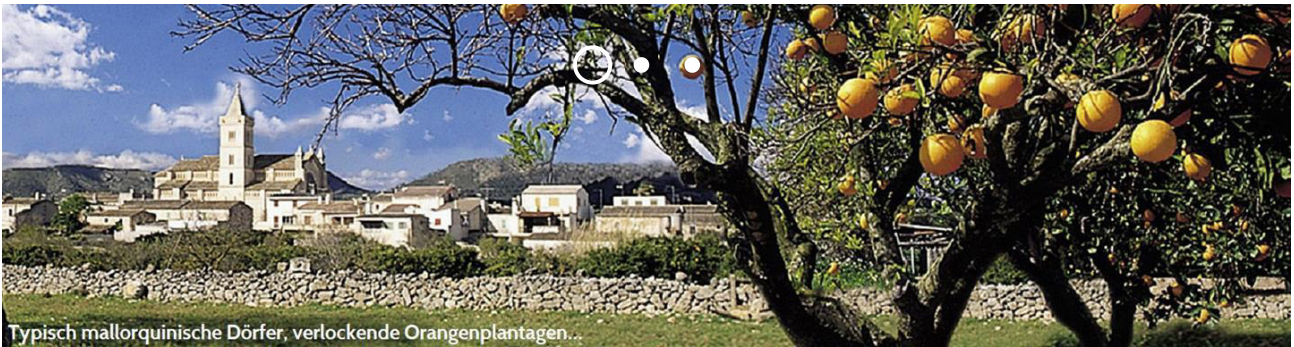
Typisch mallorquinische Dörfer, verlockende Orangenplantagen...

Sie befinden sich hier: Reiseziele > Europa > Mallorca > Doppelsternfahrt