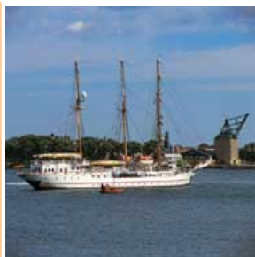
Kopenhagen Segelschiff