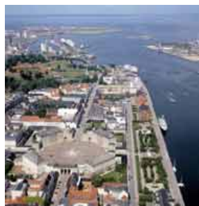
Kopenhagen Amalienburg