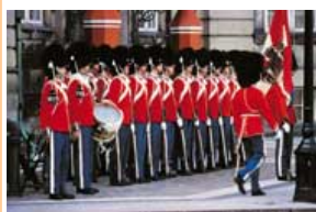
Kopenhagen Leibgarde

Ein Highlight dieser Tour ist der Müritz-Nationalpark. Das Dörfchen Ankershagen, wo der Troja-entdecker Schliemann aufwuchs, liegt auf dem Weg. Adler kann man mit Glück in Federow beobachten. Übernachtung in Waren/Umgebung