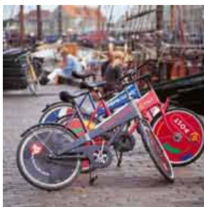
Kopenhagen Mieträder

Berlin - Rostock - Kopenhagen > individuelle Reise