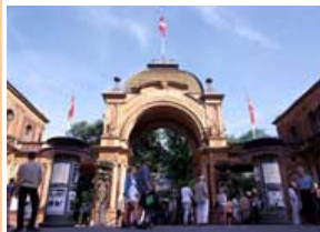
Kopenhagen Tivoli