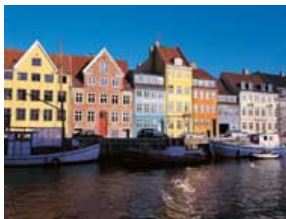
Kopenhagen Nyhavn